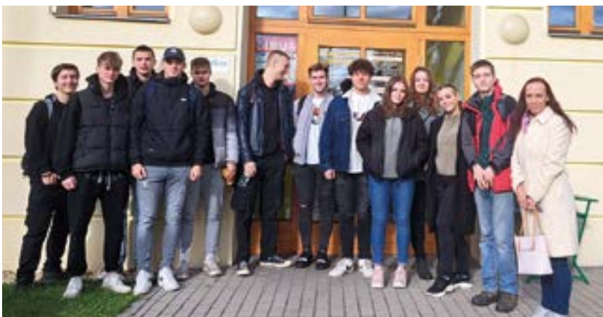
Střední průmyslová škola stavební Opava