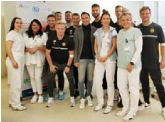
FK ISMM Město Albrechtice