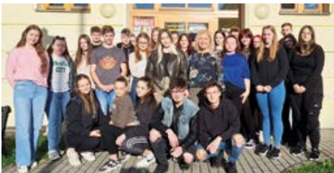
Střední zdravotnická škola Opava