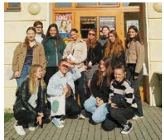
Slezské gymnázium Opava