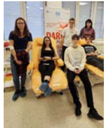
SOŠ dopravy a cest. ruchu Krnov