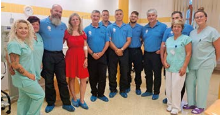
Městská policie Krnov

Jsou to budoucí stavaři ze Střední průmyslové školy stavební v Opavě, zdravotníci ze Střední zdravotnické školy v Opavě, studenti Slezského gymnázia v Opavě, studenti SOŠ dopravy a cestovního ruchu v Krnově, tým fotbalistů z FK ISMM Město Albrechtice i tým Městské policie Krnov. Děkujeme, těšíme se na vás znovu i na další týmy, které se přidají!