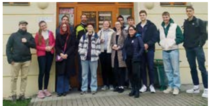
Slezské gymnázium Opava