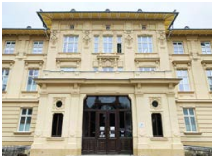
Současný vzhled budovy ředitelství doznal velkých oprav.