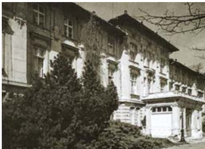
Historická budova - ředitelství - SN v Opavě.

Současný boj s pandemií zvládá naše nemocnice díky maximálnímu nasazení lékařů, sester a všech zaměstnanců v rámci možností velice dobře a dostává tak svému jménu i dlouhé úspěšné historii. Před dokončením je speciální almanach plný historických i nových fotek a krátký video dokument.