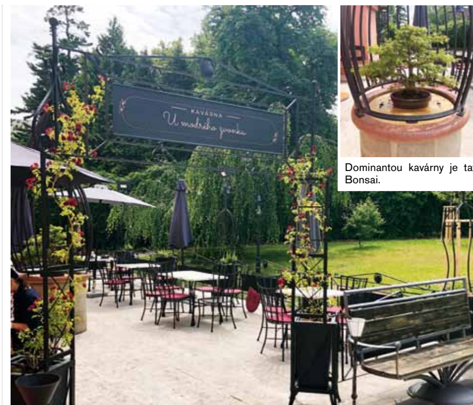
Dominantou kavárny je tato Bonsai.