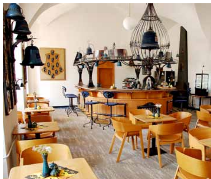
Dokončený interiér Kavárny U Modrého zvonku uměleckým kovářem Imrem.

vě zde byly okolo starobylého zděného opevnění vysázeny záhony s rododendrony, hortenziemi a další květenou. V prostoru byly vysázeny japonské bílé třešně, které budou tvořit i jakousi minialej vedoucí k malému vydlážděnému prostoru, kde bude umístěn vodní prvek. Ve výrobě je již také šest laviček z bílého dřeva, které budou rozmístěny okolo fontány a chodníku.