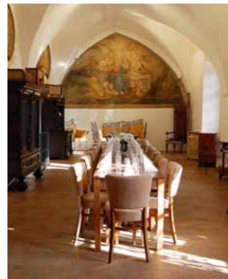
Malý sál v gotickém stylu je již k dispozici.

Fungují už také všechny vnitřní sály historického objektu. Velký, malý i gotický. A ve všech se konají jak kulturní akce, tak různé oslavy. Především je celé místo svým géniem lo- ci a historickou atmosférou vhodné pro svatby.