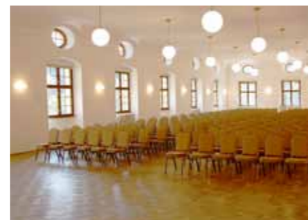
Velký sál vyhovuje všem společenským akcím.

V malém sále se konají hlavně soukromé oslavy. Gotický sál bude již brzy pro tyto účely sloužit také. Navíc už dnes se probíhají různé výstavy a ještě letos se počítá s tím, že součástí prostoru bude i vinotéka. „Svatby tady můžeme pořádat kdekoli. Na zahradě, v případě špatného počasí se může přesunout do gotického nebo malého sálu. Větší svatby se pak konají i ve velkém sále,“ říká Schreiber a pokračuje: „Je to tady opravdu ideální ze všech úhlů pohledu. Kdo chce církevní obřad, je hned vedle kostel svatého Ducha. Kdo chce světský obřad, může ho mít kdekoli u nás. Sto padesát metrů odsud je pak parkovací dům, takže je vyřešeno i parkování pro hosty.“ Ostatně v 14. října se tu uskuteční velký svatební veletrh, kam mohou lidé přijít načerpat inspiraci.