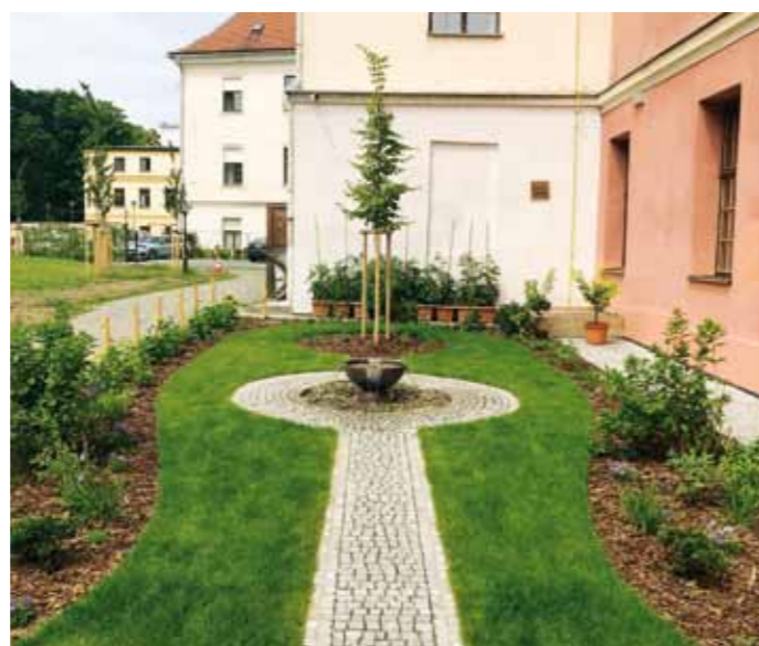
Součástí areálu je klidová zóna s pestrými zahradnickými prvky.