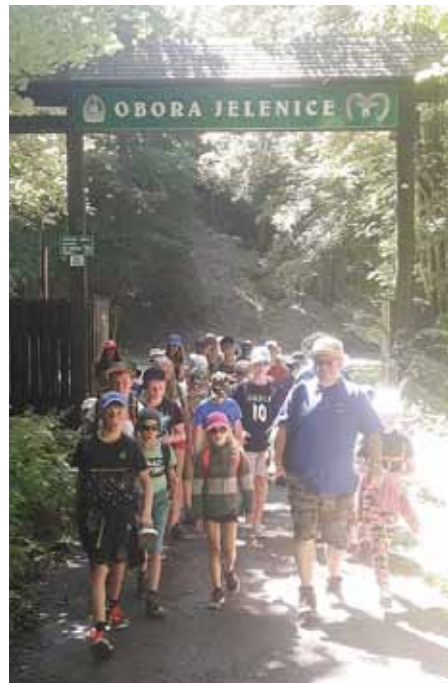
Tábormníci z Filipovic si exkurzi obory Jelenice užili.

Panenské přírody a divočiny je u nás už pomálu a neustále jí ubývá. Mladí lidé tak mají omezené možnosti, jak se s ní na vlastní kůži a oči seznámit. Také proto je obora Jelenice na Vítkovsku tak výjimečná. Nejenže se tady postupně obnovuje lesnatá krajina, ale volně zde žijí stáda různých druhů divoké zvěře od muflonů, daňků přes jeleny po divoká prasata. Přidanou hodnotou je, že se sem po domluvě mohou v rámci exkurzí přijít blíže seznámit s vzácnou tuzemskou flórou a faunou i děti. Součástí je i odborný výklad, který malým návštěvníkům zdejší krásy a divy přírody přiblíží.