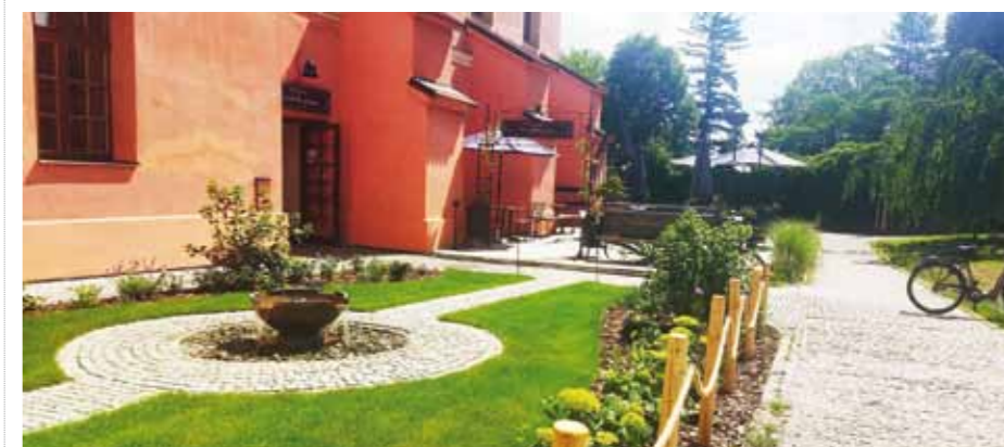
Pohled, který se naskytne návštěvníkům při vstupu do minoritského areálu.