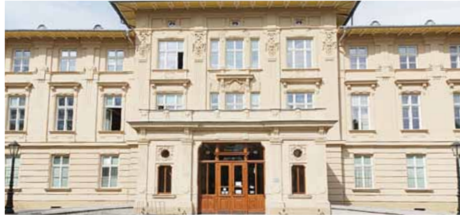
Ředitelství SNO s opraveným parkovištěm.

Slezská nemocnice v Opavě je největší nemocnicí zřízenou Moravskoslezským krajem. Je to nemocnice pavilonového typu, která se rozprostírá na pozemku o ploše 9 hektarů. Její základy byly položeny dne 10. ledna 1899 na Olomoucké ulici a areál s 18 pavilony, z kterých 12 sloužilo zdravotní péči, byl slavnostně otevřen dne 2. prosince 1900.