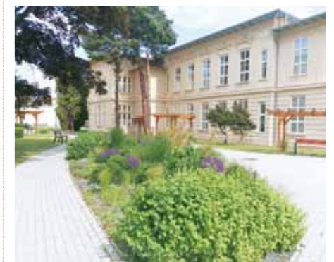
Relaxační zóna mezi pavilony E a H.