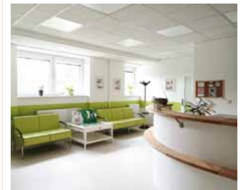
Kožní ambulance v Domově sester.