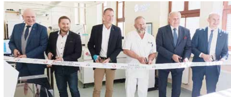
Slavnostní spuštění robotické laboratorní linky SNO.

Slezská nemocnice v Opavě se připojila k rostoucí skupině nemocnic, které využívají ve svých laboratorích zcela novou automatickou robotickou laboratorní linku Dx A 5000 Fit. Zatím ji mají v republice jen čtyři nemocnice, pátá se nyní buduje v Kyjově. Danou plně